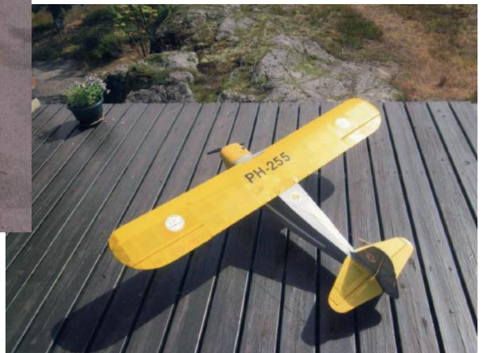
Den næstnyeste model, nr. 255