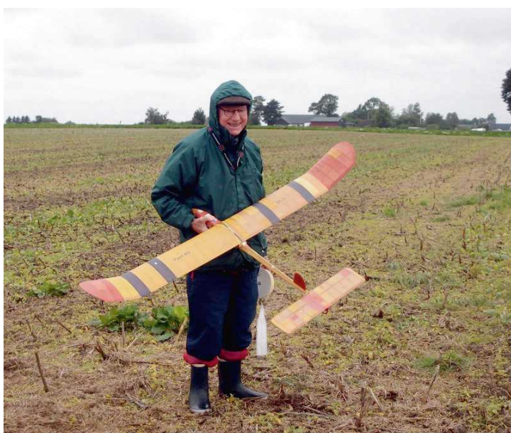
Ove med Pjerri 69

Logiet som Bo-Eskil havde sørget for var er udmærket B&B i byen Glimmingebro. Ros til arrangørerne som gennemførte SMét trods de vanskelige forhold. Bo-Eskil havde sørget for en tom hestetrailer der med ly for blæst og regn tjente som "kontor" med startkort resultattavler.