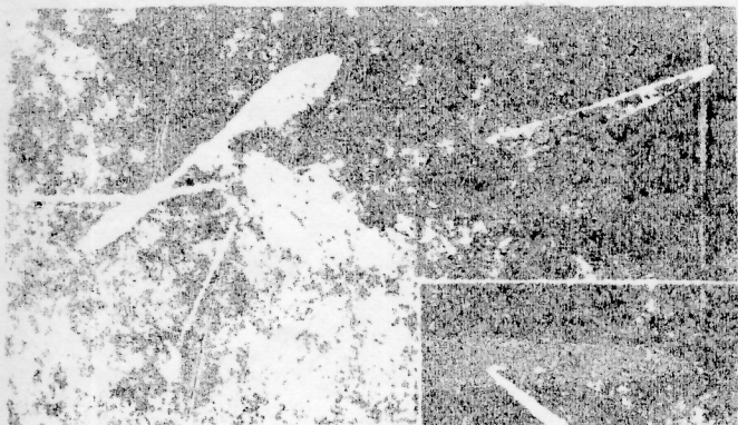
Modellbyggen är 4 i antalet. De byggdes av Anders Dörrnell med hjälp av en grupp av skolelärare i skolorna. Planen utarbetades av författaren och utgavs i form av en broschyr.