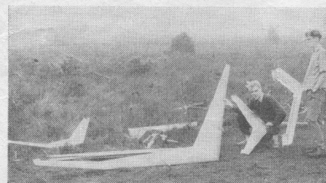
Lennart Olsson och Urban Månsson jämför sina små modeller med den engelska giganterna som hade en spännvidd av ca 5 meter. Den stora modellen flög underbart i lugnt väder, startade spikrakt och flög mycket långsamt med låg sjunkhastighet