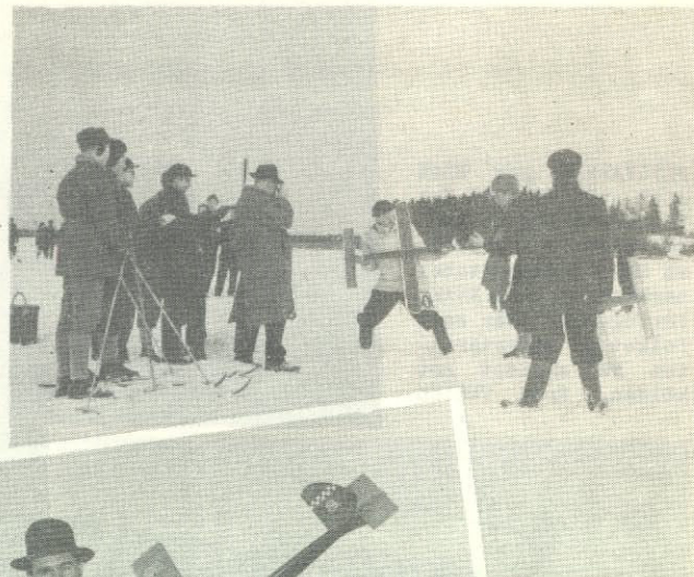
1955 ÅRS VINTERTÄVLING I Västerås blev en riktig vintertävling. Lagom med snö, lagom kallt och med en synnerligen vältrimmad funktionärsstab.

BD 124 Kiruna Mfk, Banningjörsv. 1, Kiruna C, BD 369 Bodens Mfk, Korpg. 17, Boden.